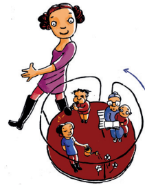
Vielfalt der Zwecke

6. Eine Bürgerstiftung wirkt in einem breiten Spektrum des städtischen oder regionalen Lebens, dessen Förderung für sie im Vordergrund steht. Ihr Stiftungszweck ist daher breit. Er umfasst in der Regel den kulturellen Sektor, Jugend und Soziales, das Bildungswesen, Natur und Umwelt und den Denkmalschutz. Sie ist fördernd und/oder operativ tätig und sollte innovativ tätig sein.